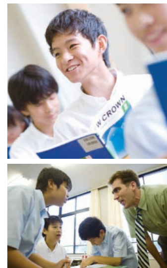
少人数制による丁寧な指導で生徒の能力を引き出す

北陸学院は、2003年度より県内初の「中高一貫教育」を実践してきました。北陸学院中学には、6年間のカリキュラムで全国の難関国公立大学を目指す「中高一貫進学コース」と中学で基礎学力を身につけ、高校入学時に自分に合ったコースを選択できる「中高発展進学コース」があり、どちらのコースも、早い時期に基礎的な学習能力の土台を固めます。そのため、子どもたちは、部活に、学校行事に、また好きな習