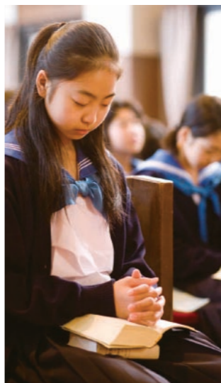
人格形成に大きな役割を果たす毎朝の礼拝

い事に取り組み、彼らの人生にとって大きな財産となる友人との時間を楽しみながら、無理なく大学入試への準備を整えることができます。また、北陸学院では、キリスト教教育を軸とした心の教育をすべての土台としており、思春期を迎えた多感な子どもたちの、人間的な成長をしっかりとサポートします。