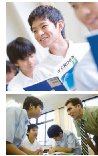
少人数制による丁寧な指導で生徒の能力を引き出す

北陸学院は、2003年度より県内初の「中高一貫教育」を実践してきました。北陸学院中学校には、6年間のカリキュラムで全国の難関国立私立大学を目指す「中高一貫進学コース」と中学で基礎学力を身につけ、高校入学時に自分に合ったコースを選択できる「中高一貫発展進学コース」があり、どちらのコースも、早い時期に基礎的な学習能力の土台を固めます。そのため、子どもたちは、部活に、学校行事に、また好きな習