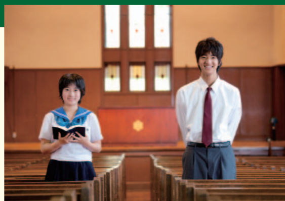
●詳しくは、本校にお問い合わせいただくか、ホームページをご覧ください。