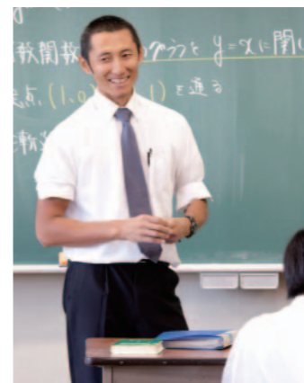
高校での数学の授業

また、数学は苦手意識を持ちやすい科目でもあります。しかし逆に「好き」と思うことさえできれば、スピーディーかつ自然に学力は伸びていきます。生徒の中に「好き」という感情が芽生えれば、そこを起点に学びに対する前向きな姿勢が生まれるのです。授業では、こうした自主性をいかにして育むかを常に念頭に置いて、生徒個々の内面の変化に寄り添うよう努めています。