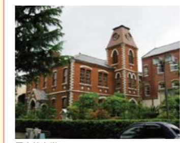
同志社大学 ※推薦枠は今後変更になる場合があります。詳細は本校までお問い合わせください。

指定校推薦枠の豊富さ 「キリスト教教育同盟加盟校」に加入している大学へ優先して推薦できる特有の制度があります。代表的なものとして、同志社大学に12名、関西学院大学に16名、青山学院大学に7名それぞれ有しており、県内でこれらの大学にもっとも近い高校と言えます。他にも、全国におよそ130大学、約500名の指定校推薦枠を有し、幅広い選択肢の中から将来を指すことができます。