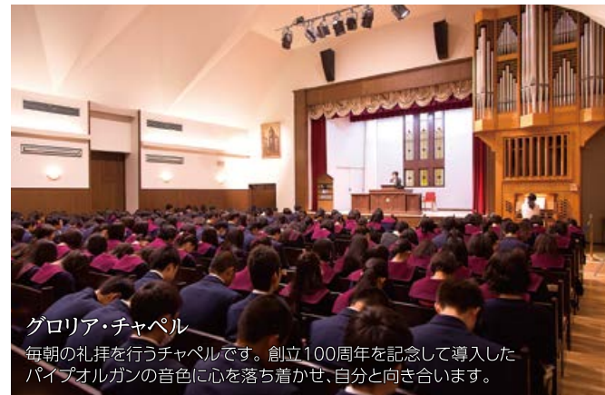
グロリア・チャペル

毎朝の礼拝を行うチャペルです。創立100周年を記念して導入したパイプオルガンの音色に心を落ち着かせ、自分と向き合います。