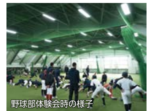
野球部体験会時の様子

ミッション中学校野球部の歴史を一緒に拓こう! 活動日程: 火・木・金・土・日 活動場所: 北陸学院三小牛グラウンド、 屋内練習場・校内施設、近隣グラウンド