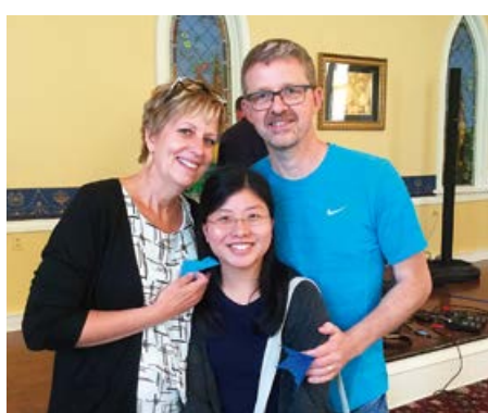
▲ 長期留学中はホストファミリーにさまざまな場所に連れて行ってもらいました。

たら、言葉も次第に理解できて、毎日楽しく過ごせました。クラスではさまざまな国の学生がお互いを尊重しながら学んでいる、「世界の一員である日本」を意識するきっかけになりました。花の日訪問や収穫感謝訪問に参加して、初めてボランティア活動に携わったことも、ミッションでの大切な思い出です。老人福祉施設のお年寄りの方々が私たちの訪問を喜んでくださる姿を見て、私の心も温かくなりました。高校での留学とボランティアの経験を通じて、将来は国際社会の課題を解決し、福祉の仕組みを改善できる人になりたいと目標が定まりました。目標の実現に向けて、大学では寮で留学生と共同生活をしたり、海外でのフィールドワークに参加したりしています。また留学にも行って、さらに学びを深めたいですね。これからミッションに入るみんなにも、いろいろな現場に足を運んで、自分が興味を持っていることや学びたいことをどんどん発見してほしいです。