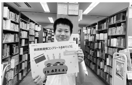
入学からの1年半で336冊の本を読みました!

実施日 10月10日(金) 参加生徒数 14名 場 所 うつのみや 金沢香林坊店 入った冊数 42冊