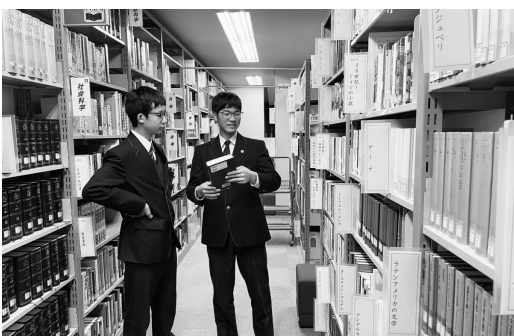
クラスみんなはどんな本を読みたいかな？