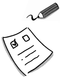
イラスト：岡崎 咲那

アンケートの結果、本を読むことが好きな人が6割いて、勉強や部活で忙しいはずなのに本を読む頻度が高い人がいて驚きました。読書の習慣が学力に影響すると思う人が6割いて嬉しかった反面、活動を通してもう少し増やせていたらよかったですと思いました。