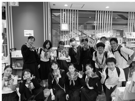
色々なジャンルの本を選びました!

私は2年連続で選書会に参加しました。興味のある本を次々に手を取っていきました。また、今年とは去年とは違った発見もありました。去年の選書会では、同じようなジャンルの本が多く入りましたが、今年は本当に色々な本が入りました。ミステリーや新書、ライトノベル、ノンフィクションなど、多様なジャンルの本が入りました。たくさん本が入ったので、是非図書館に足を運んで、本を手にとってほしいと思います。