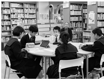
読書会の本は何かがいいかな？

図書委員長は多忙ですが、とても楽しい図書委員会の一員として活動ができ、自分の成長につながり、とても嬉しく思います。これからも図書委員会の活動で、少しでも図書館に来る人が増え、本に興味を持ってもらえたらと思います。