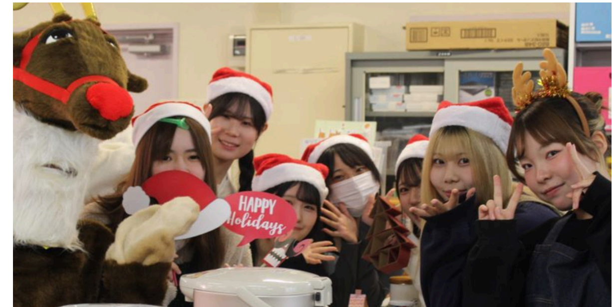
キャンパスにぎわいプロジェクト