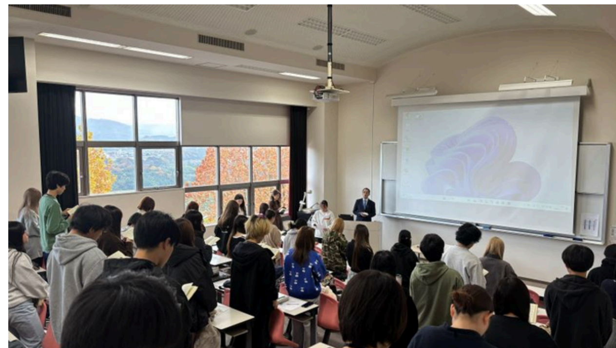
オータム・セミナー