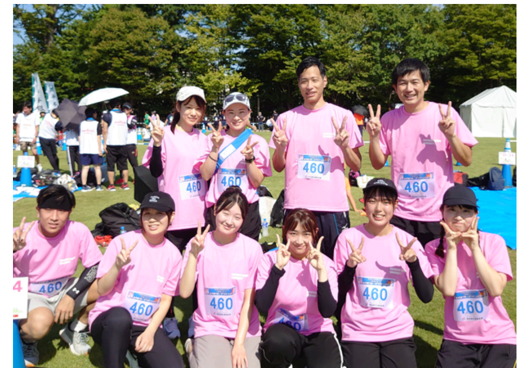
キャンパスにぎわいプロジェクト