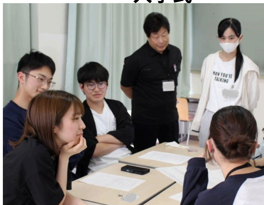
フレッシュマン・セミナー